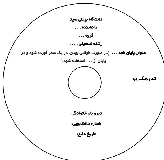
شکل ۱. مشخصات لوح فشرده (cd) تحویلی

تبصره ۳: لوح فشرده از رنگ روشن انتخاب و روی آن با ماژیک مخصوص مشخصات مطابق شکل زیر، درج شده باشد.